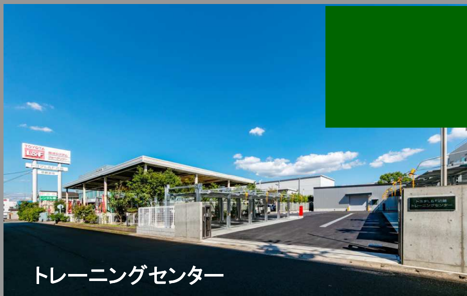
トレーニングセンター